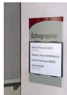
Identification de service