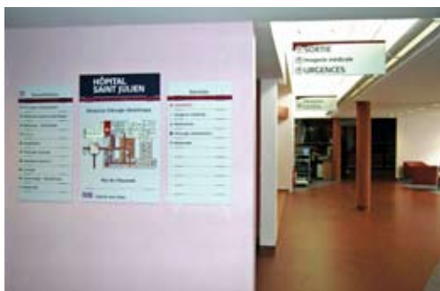
Synoptique des consultations